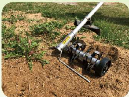
芝生削りやグラウンド整備