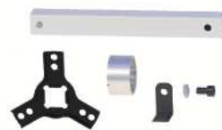
ロングタイプ変換キット