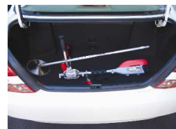
分割出来るので、持ち運びもコンパクトに