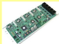
制御基板が内蔵されています

A: エンジン刈払機 23cc ~ 25cc 相当です。 力強く快適な草刈りをご体感下さい